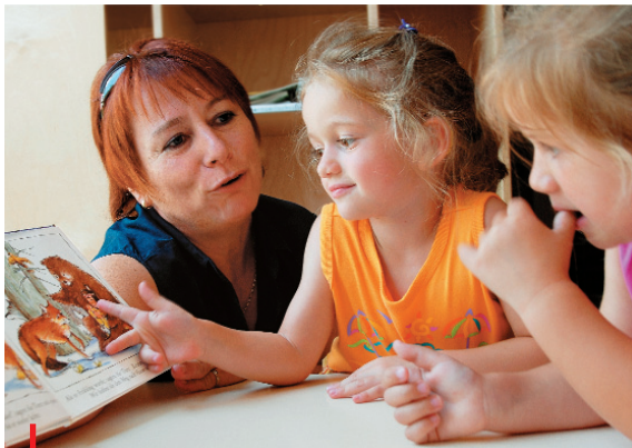
Hör- und Sprachförderung mit Kinderbüchern

Die frühe ganzheitliche Unterstützung von Kindern hörgeschädigter Eltern gehört ebenfalls zu unserem Aufgabenbereich.