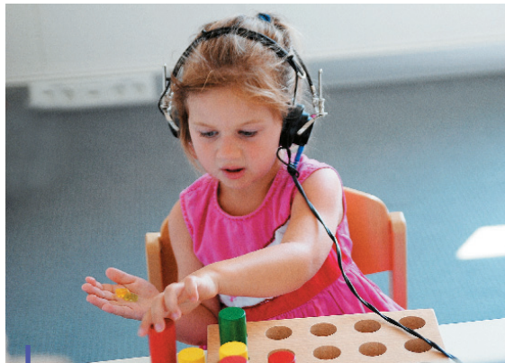
Kindgemäße Hörprüfungen: hören und spielen