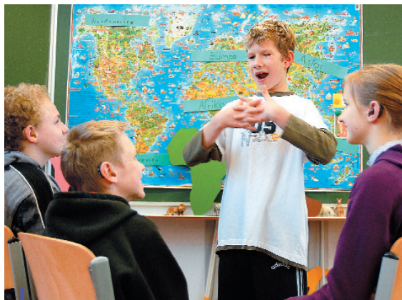
Schülerreferat mit Gebärden