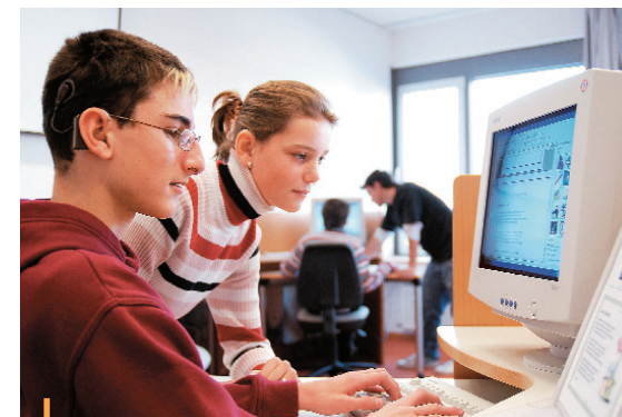
Lernen am Computer